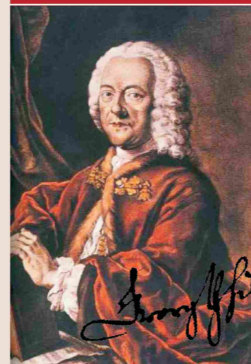
GEORG PHILIPP TELEMANN (1681-1767)