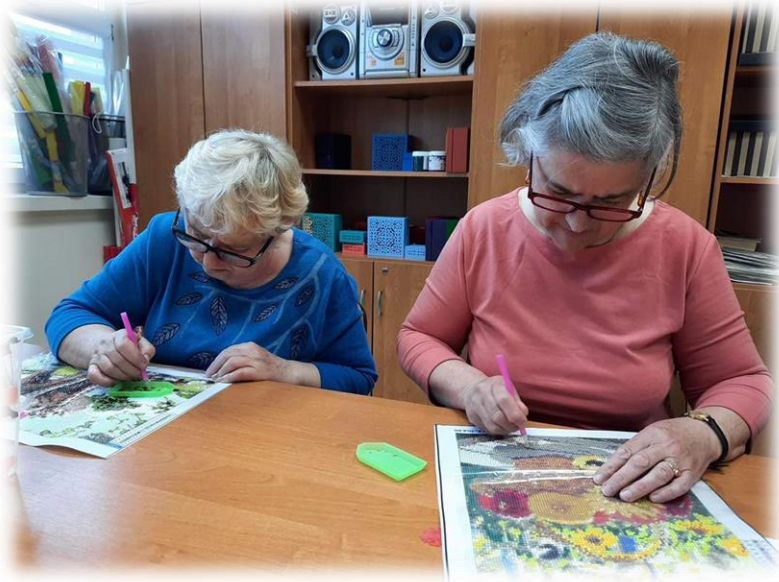
prace metodą diamond- painting