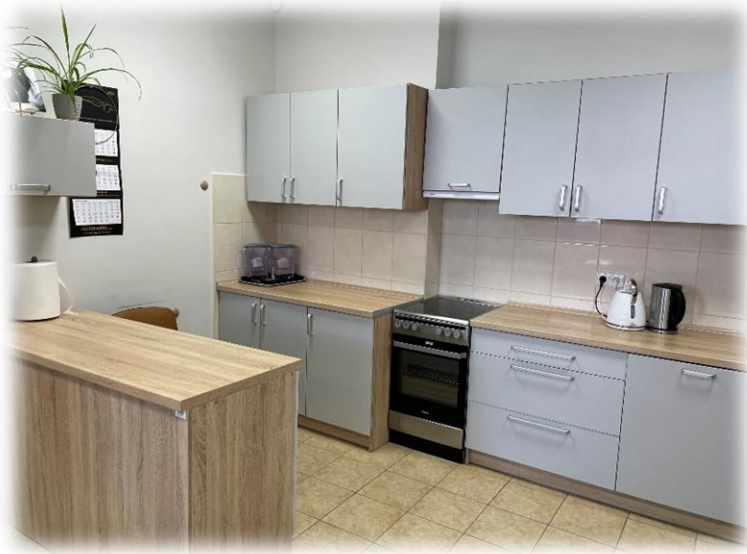
pracownia gospodarstwa domowego