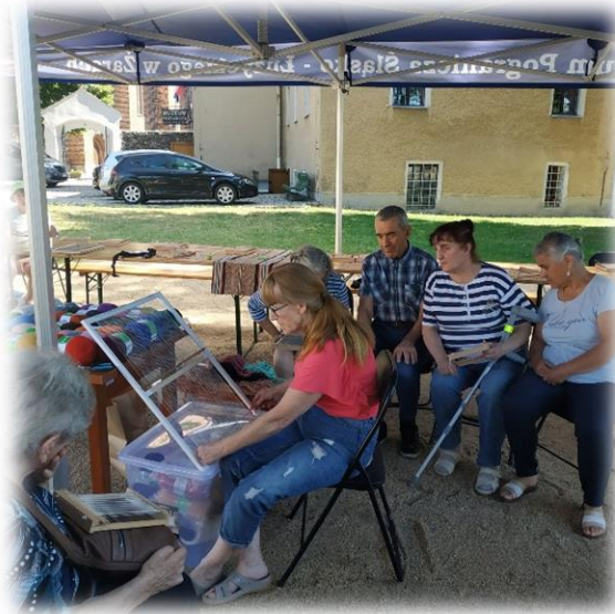
warsztaty w muzeum