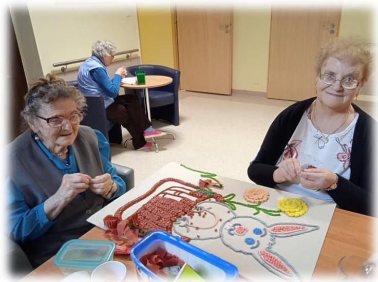
prace z kulek z bibuły