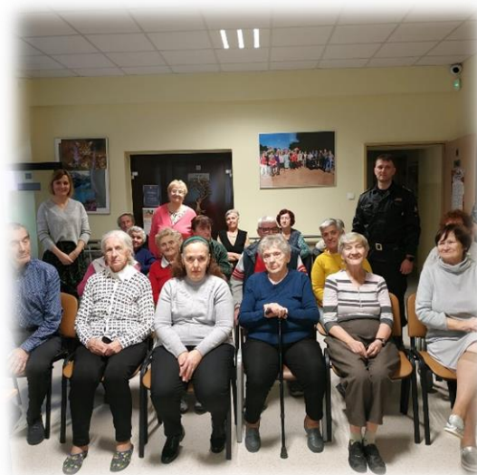
Spotkanie z przedstawicielem Straży Pożarnej