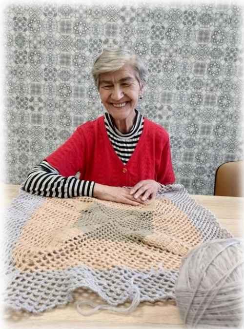
prace na drutach