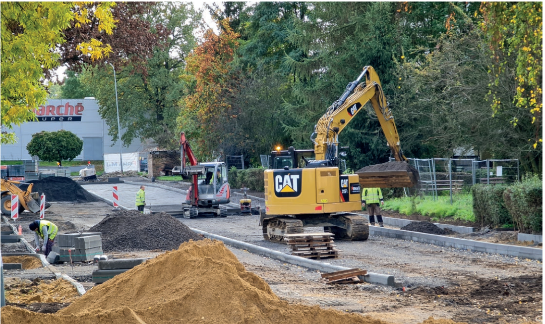
Rozbudowa ul. Krótkiej i Szymanowskiego

Tak wybrali głosujący i szanują tę decyzję. Rola Budżetu Obywatelskiego to aktywizowanie i konsolidowanie mieszkańców. Dzięki niemu przedsięwzięcia, które zdobyły największe poparcie w czasie głosowania realizowane są szybciej.