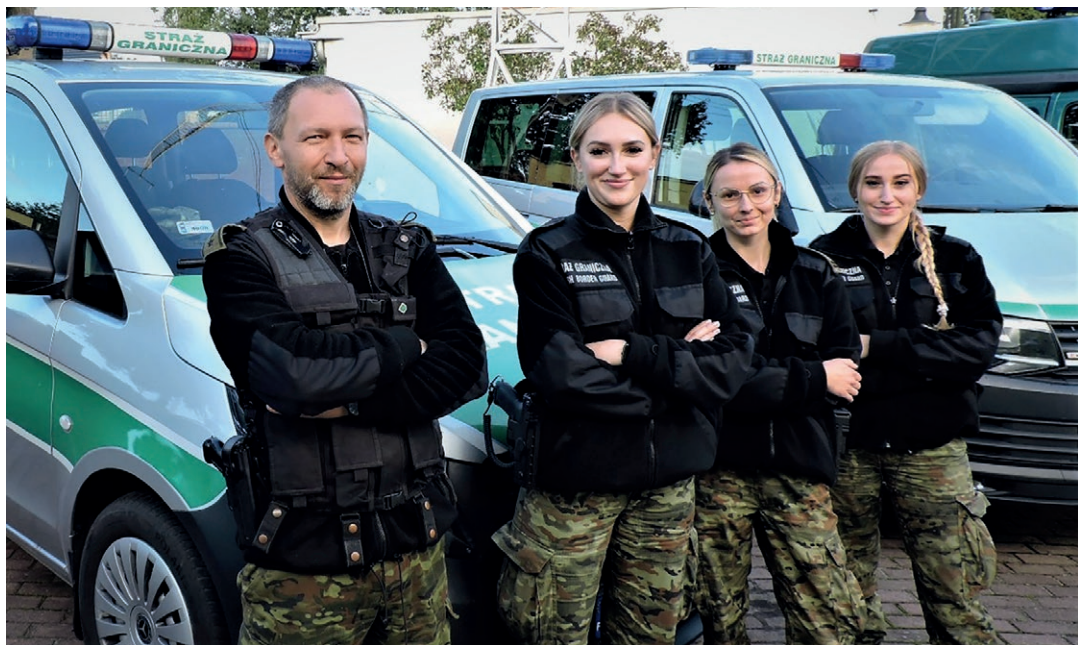
Funkcjonariusze z PSG w Tuplicach

Funkcjonariusze z Placówki Straży Granicznej w Tuplicach, codziennie dokonują czynności kontrolnych i weryfikacyjnych wobec cudzoziemców, w tym także ob. Ukrainy. Często działania te mają charakter prewencyjny. Podczas prowadzonych czynności, w ramach kontroli legalności pobytu czy zatrudnienia, na bieżąco analizują sytuację prawną kontrolowanego cudzoziemca, w oparciu o szereg równolegle obowiązujących przepisów.