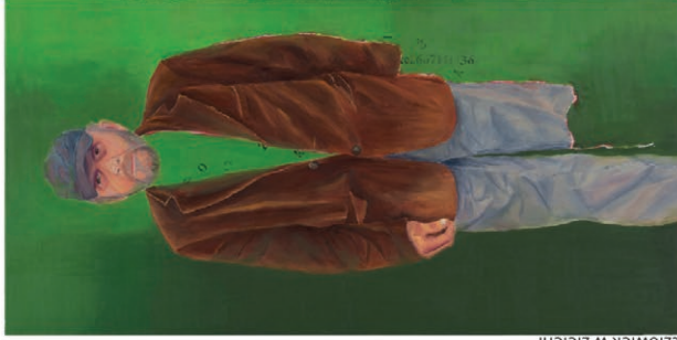
człowiek w zieleni