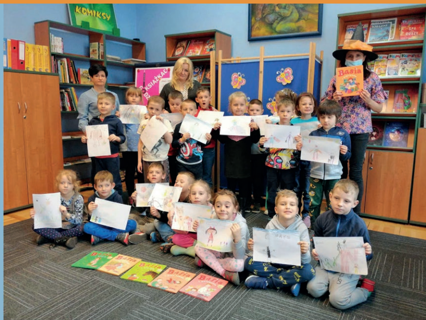
W ramach obchodów Tygodnia Bibliotek 8 - 15 maja 2021 r. w Oddziale dla Dzieci MBP Żary gościliśmy grupę Krasanali z Miejskiego Przedszkola w Żarach. Przedszkolaki, wzięły udział w zajęciach pt. „Basia i biblioteka”