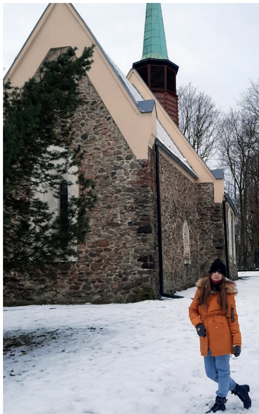
Anna - kościół Piotra i Pawła