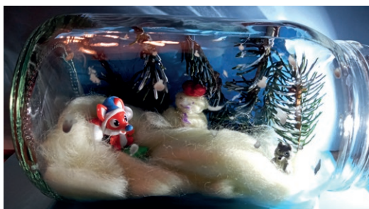
Janek, lat 7