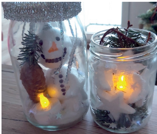
Amelia, lat 9