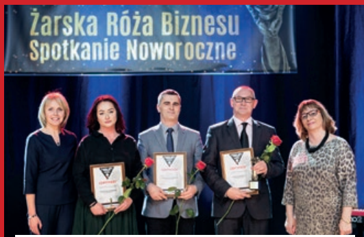
KATEGORIA FIRMA ROKU 2017