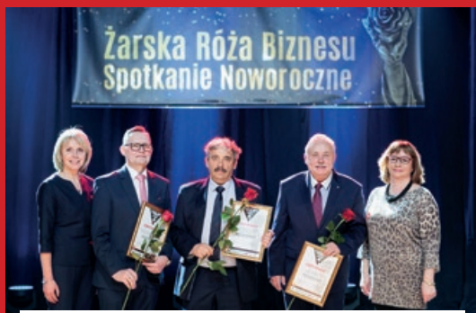
KATEGORIA MIKROPRZEDSIĘBIORCA ROKU 2017