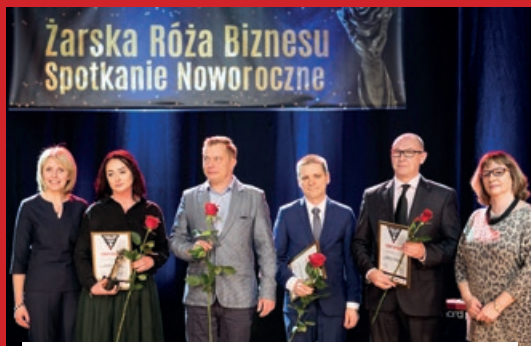
KATEGORIA WYDARZENIE GOSPODARCZE ROKU 2017