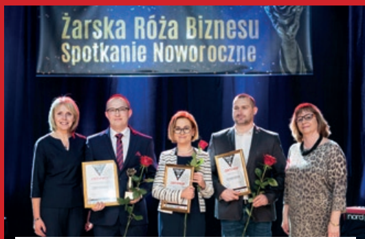
KATEGORIA MECENAS SPORTU - KULTURY ROKU 2017