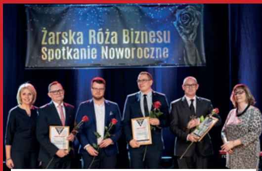
KATEGORIA PRODUKT - USŁUGA ROKU 2017