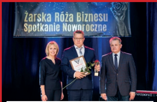
NAGRODA SPECJALNA Burmistrz Miasta Żary