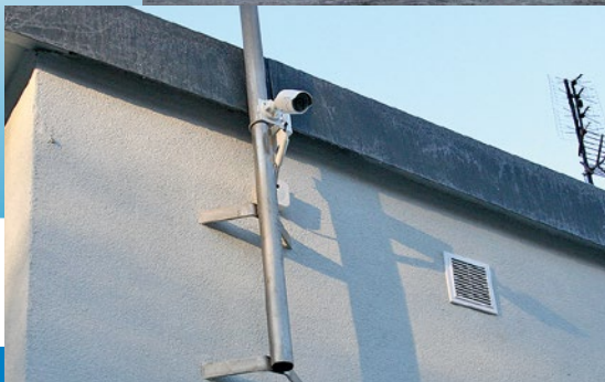
Monitoring na stadionie Syrena.