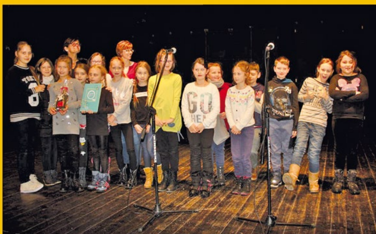
Laureaci XXVII Powiatowych Spotkań Grup Kolędniczych i Jasełkowych, grupa „Szelest” ze Szkoły Podstawowej nr 2

Luty – marzec - Galeria „Zaścianek”, ŻDK filia „Kunice” ul. Grunwaldzka 3. Wystawa rysunku Edyty Pawłowicz