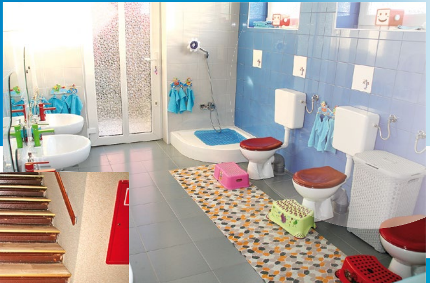
Nowe łazienki dla dzieci w Miejskim Żłobku nr 3 w Żarach.

W Zespole Szkolno-Przedszkolnym z oddziałami Integracyjnymi w Żarach wyremontowane zostały korytarze, wymieniona podłoga oraz okna.