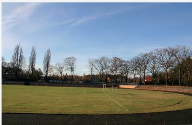
Przebudowa Stadionu Lekkoatletycznego na „Syrenie” - dofinansowanie 1,5 mln zł.