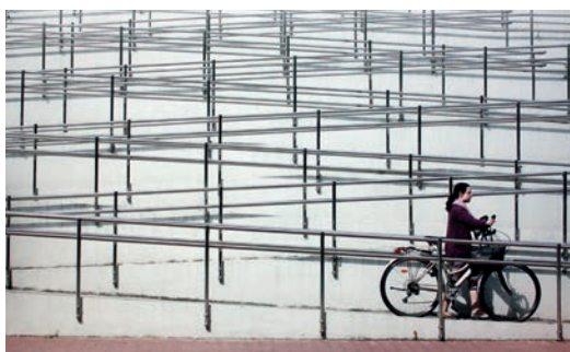
I nagroda - Krzysztof Zając