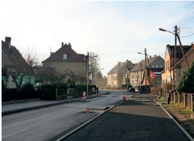
Przebudowa ul. Zgorzeleckiej - dofinansowanie 2 mln zł.