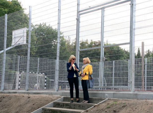
Przebudowa Boiska Wielofunkcyjnego na „Syrenie” - dofinansowanie 120 tys. zł.