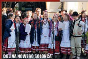
DOLINA NOWEGO SOŁOŃCA