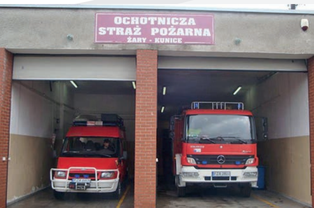
Zakup lekkiego samochodu ratowniczo - gaśniczego oraz specjalistycznego sprzętu dla OSP Żary - Kunice - dofinansowanie ponad 200 tys. zł.