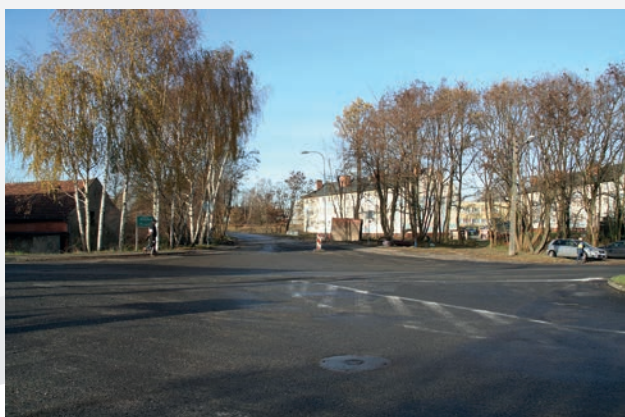
Przebudowa ul. Okrzei (od ul. Częstochowskiej do ul. Fabrycznej), budowa ronda na skrzyżowaniu ulic: Okrzei, Zgorzeleckiej, Witosa i Fabrycznej - dofinansowanie 3 mln zł.