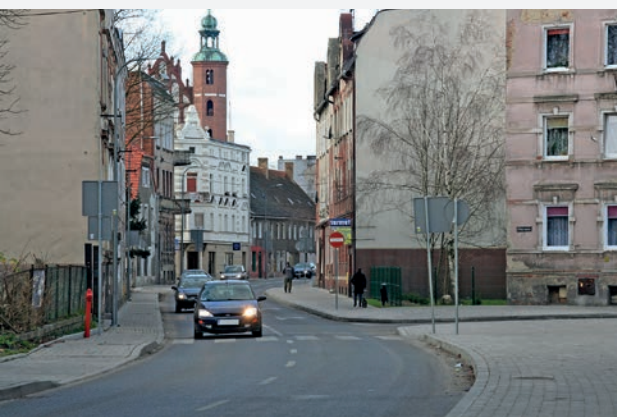
Przebudowa ul. Żagańskiej - dofinansowanie 3 mln zł.