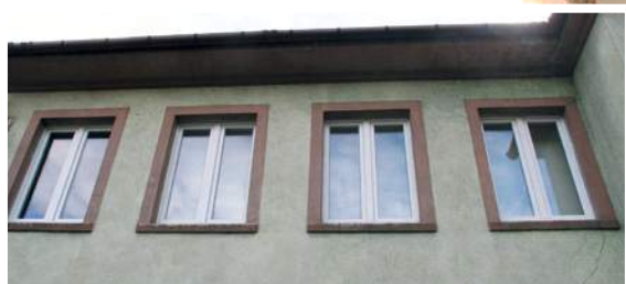
Wymiana okien ponad 28 tys. zł