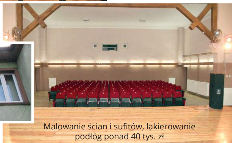
Malowanie ścian i sufitów, lakierowanie podłóg ponad 40 tys. zł