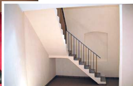
Modernizacja zaplecza sceny ponad 38 tys. zł