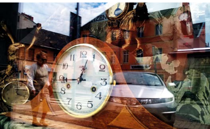
Foto: Główna nagroda w konkursie „24 sierpnia w Żarach - M. Maciejewska „Witryna czasu”