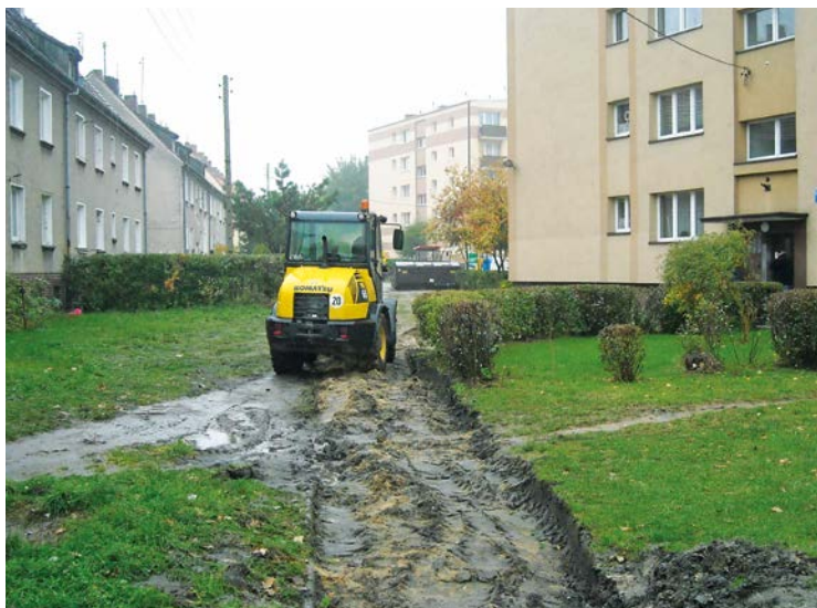
ul. Męczenników Oświęcimskich - remont chodnika