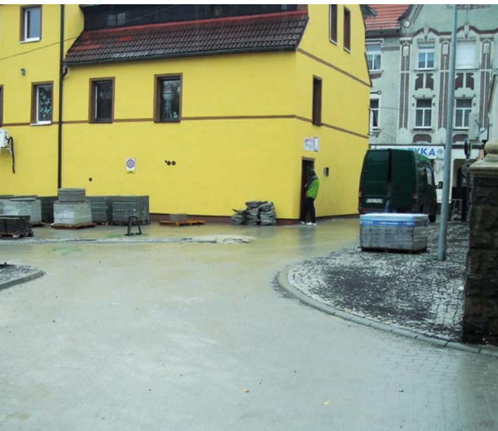
ul. Buczka – remont podwórka za Sądem Rejonowym w Żarach