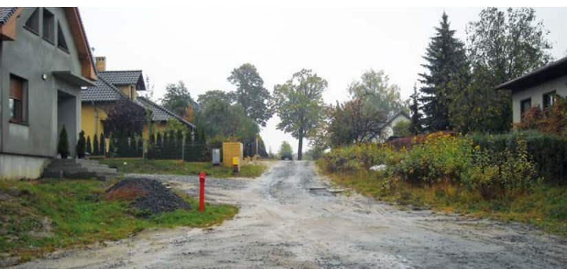
ul. Leśna - remonty ulic przyległych