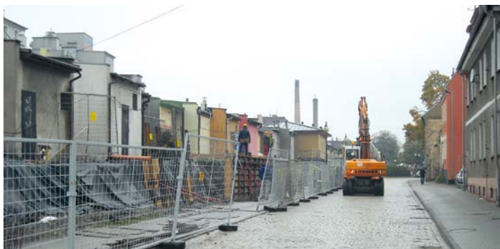
Zagospodarowanie terenu pomiędzy ul. Mieszka I, a ul. Kąpielową